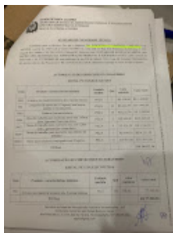
WhatsApp Image 2022-08-22 at 16.32.45.jpeg 223K