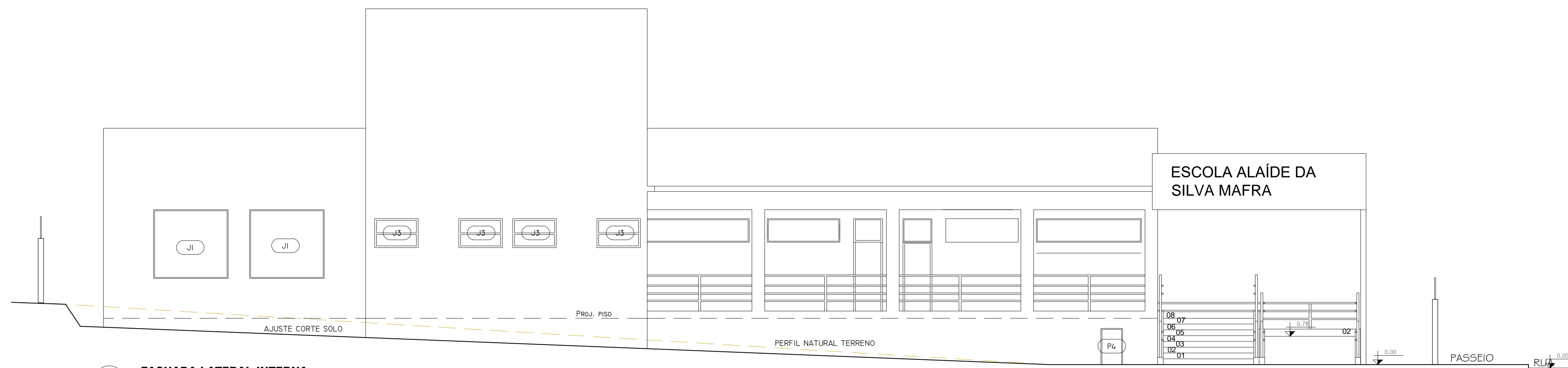
14 FACHADA LATERAL INTERNA Esc. 1/75