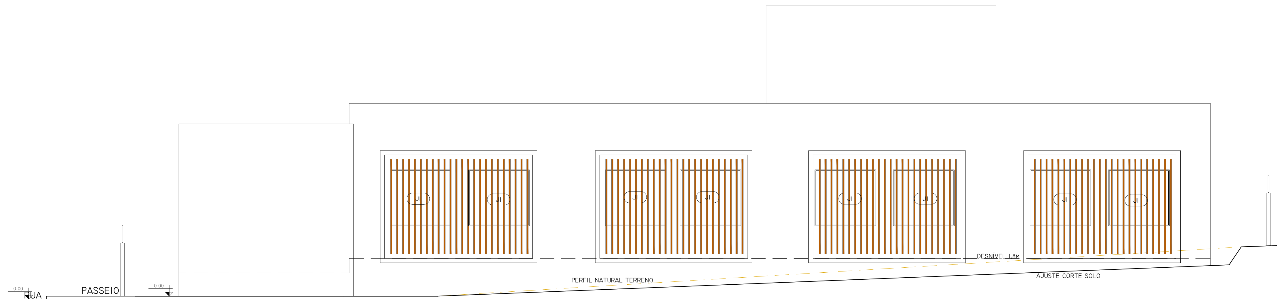
13 FACHADA LATERAL EXTERNA Esc. 1/75