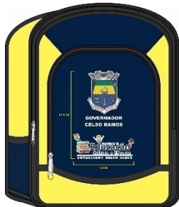
AZUL MARINHO 19-4010 TPX AMARELO OURO 13-0859 TPX

MOCHILA ESCOLAR PARA DISTRIBUIÇÃO GRATUITA PARA OS ALUNOS DA REDE MUNICIPAL DE ENSINO.