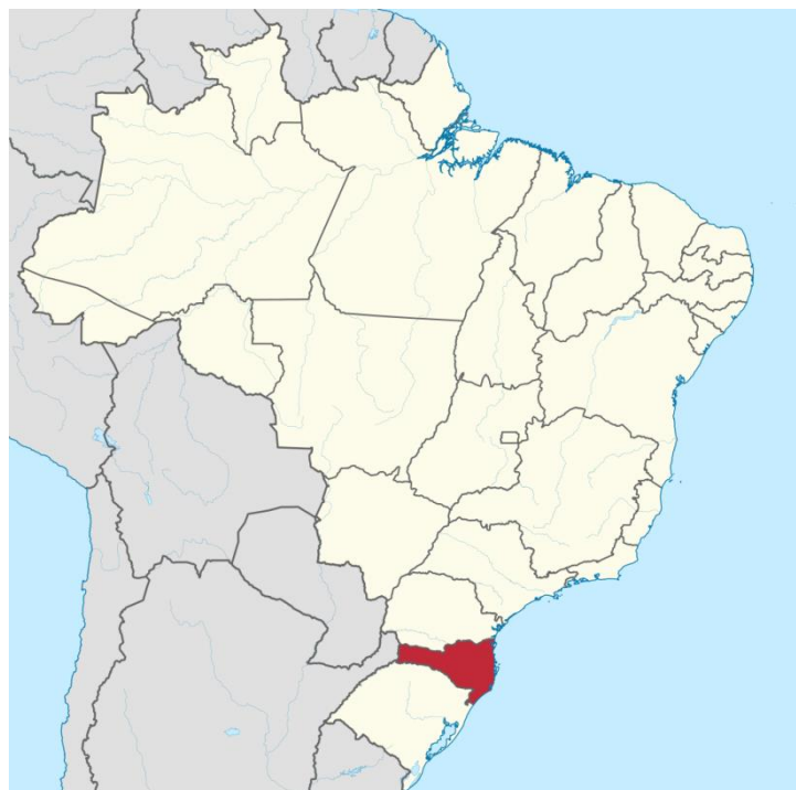
Mapa Político de Santa Catarina