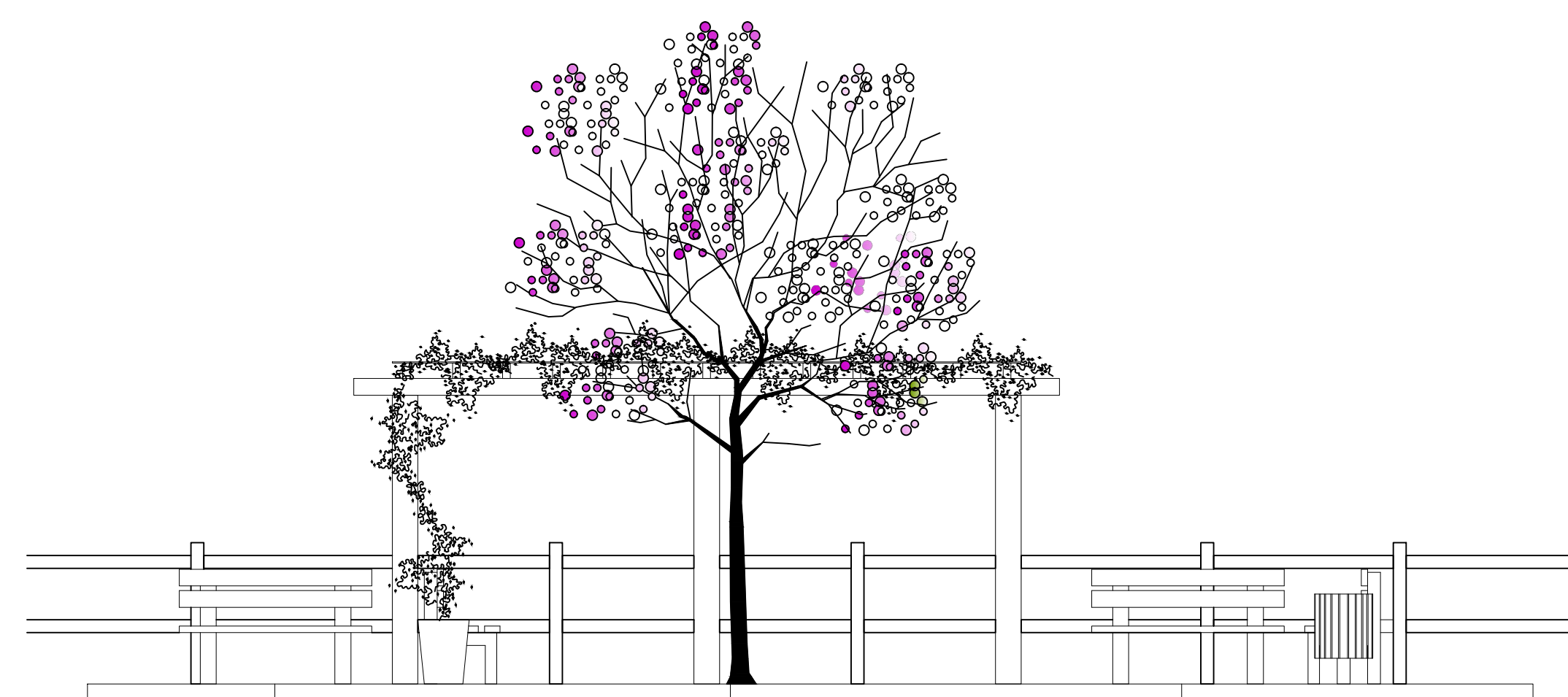
Vista 1 Sem escala